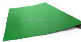
элемент карнизного свеса

Внимание! Геометрия металлических комплектующих изделий на сайте по ссылке http://zavodpromintech.ru/information_for_clients/instructions/